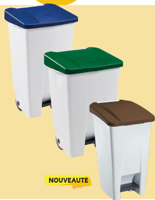
MOBILY Poubelle mobile A pédale - 60L - 80L - 120L