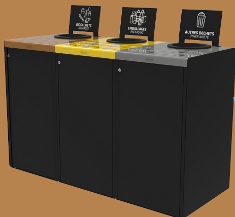
ALITRI Kit de 3 meubles Prêt à l'emploi - 3x65L - 3x90L - 3x110L