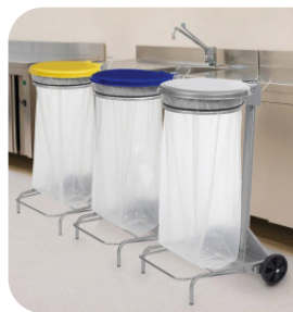
COLLECROULE Support sac Mobile à pédale - 50L - 110L