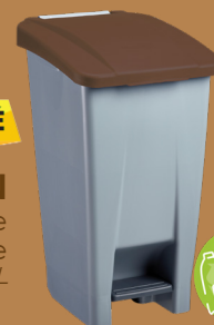
MOBILY GREEN Poubelle mobile A pédale 60L