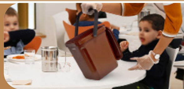
ORGANIK GREEN Poubelle compost 10L