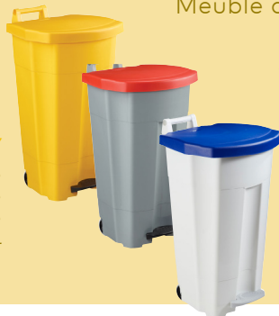
ALITRI Meuble de tri - 65L - 90L - 110L