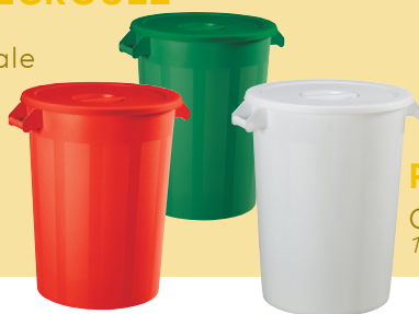
PRATIK Collecteur alimentaire 100L